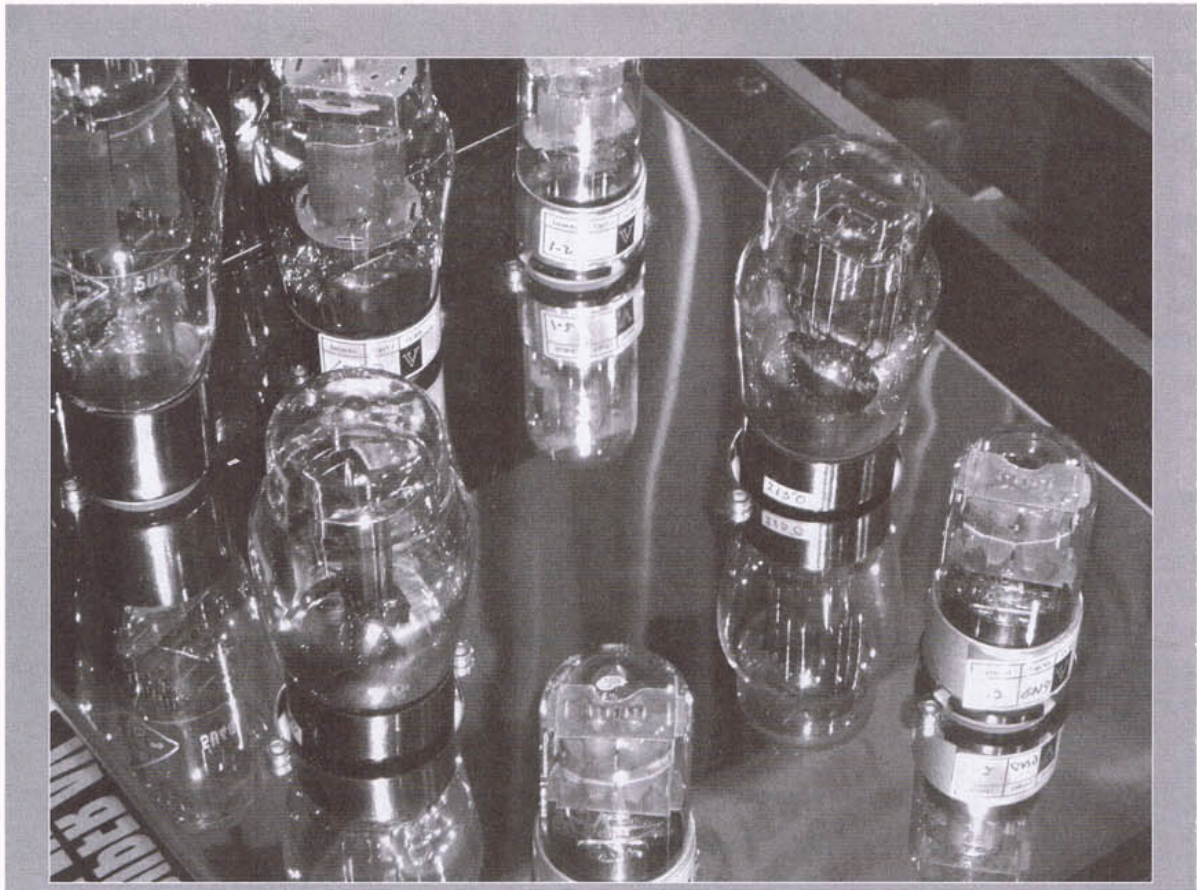
及後又試用了一對 40 古董膽，結果當然係更過癮吧！

由此證明，這套 No.26 後級在新版 No.23 策動下，已然將 Opus 控制得妥妥貼貼。跟著細心聽聽音色，呵呵，45 膽配 300B，又怎會差到那裡去呢？尤其播童麗的《啼笑姻緣》，那種喉底的貼肉質感，還有延綿不絕的嬌嗲震音，直教人心中高呼過癮！