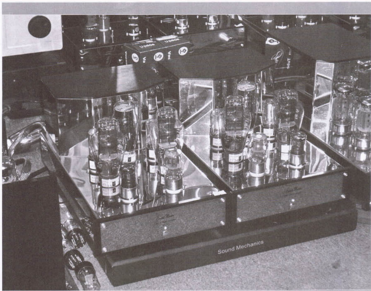
這對採用 300B 推挽的 No. 26 後級，雖然輸出只有每聲道 26W，但竟然可以將 AVALON Opus 推動得頭頭是道，真教人大感意外。

對於那對駐場揚聲器——AVALON Opus，筆者也曾在此聽過好幾次，雖然每次都有驚喜，特別是那次採用了石墨承腳之後，那種低頻上的改善，真可以用脫胎換骨來形容，但今次所配搭的後級，竟然是一套採用300B推挽的後級，那難免令人有點擔心，皆因這對Opus並非善男信女也，但既然 Peter 敢佈下如此陣勢，那必然有他的一套。好，開聲……，Oh, My God！整個音場竟然完全脫離音箱左右，並且作扇形往後張開，而音像的定位和立體聚焦，均有置身現場的活生感，