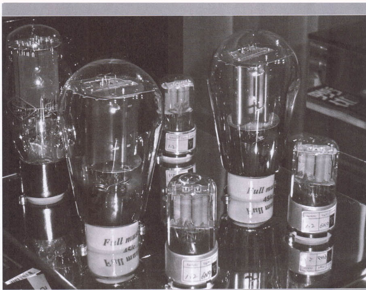
天津 FULL MUSIC 新作——45 膽。

走近去細察一下，由於筆者與 No.23 已共處了一段日子，所以一看便已肯定其機箱乃同出一轍，至於用膽亦大同小異。首先，電源部份由一支 6N9、一支 6P3P 和一支 5U4G 組成，至於放大