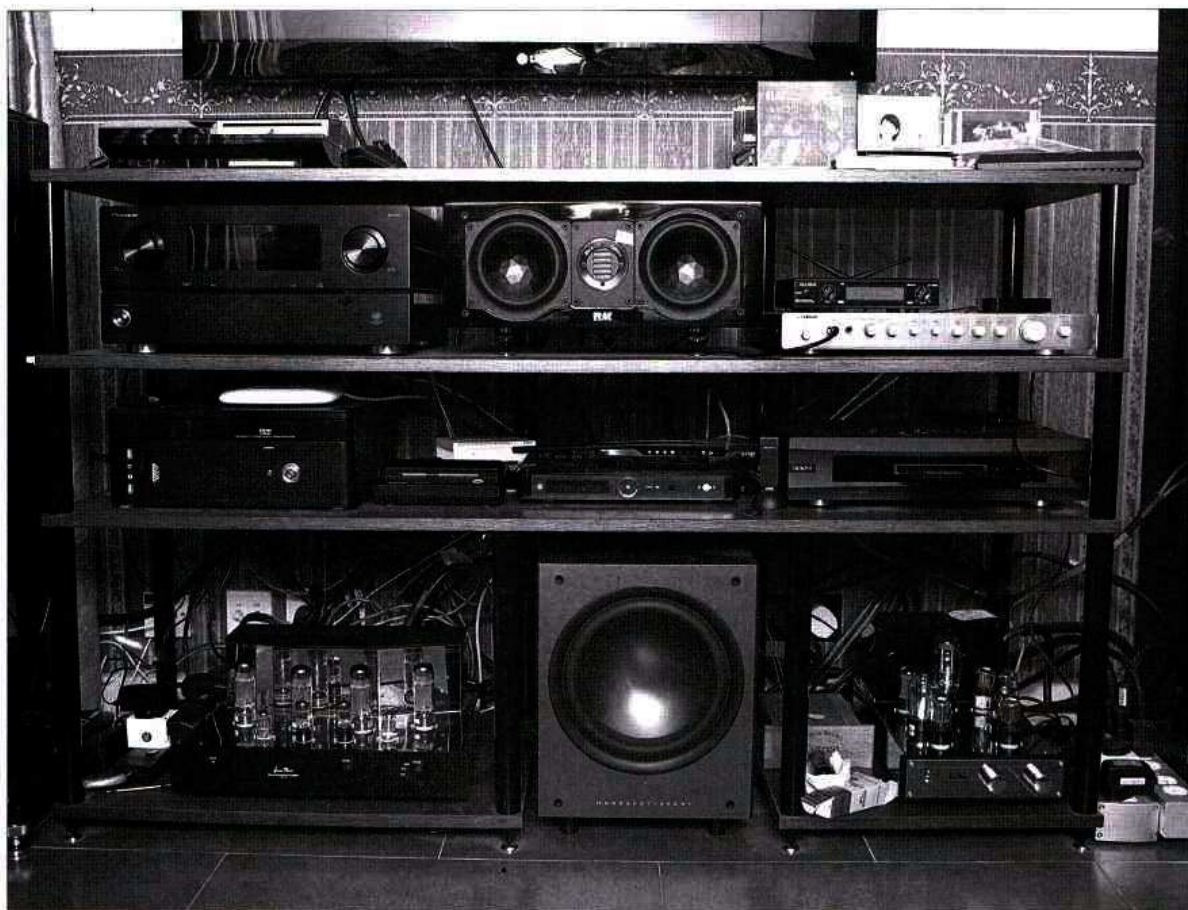
自建音響架收納了環繞聲與兩聲道體系，十分整齊。

世上大部份人都喜歡聽音樂，其中有不少人希望將自己喜歡的音樂重播得更悅耳，因而加入了玩 Hi-Fi 的行列，至於這條路走得快樂與否，就要看自己的造化了。最近筆者認識了一對喜歡聽歌、耳朵靈敏的年輕夫妻，他們利用石機進入 Hi-Fi 世界，但很快便覺得聽石機不是味兒，幸好在好友循循善誘之下，他們走進了膽機國度，短短兩年之間已經成為一對不折不扣的膽機迷，更將蝸居內的體系搞得有聲有色，無論重播中樂、爵士還是 K-Pop 一樣得心應手。