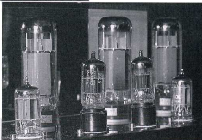
經鄧小姐雙耳鑑聽後，決定以《西電》5755 與復刻《金獅》KT77 取代隨機膽。