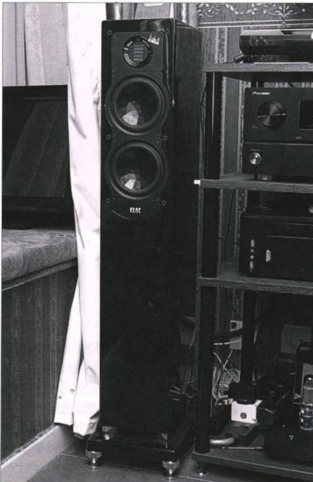
借助膽機驅除「寒氣」之後，ELAC FS247 除了保持一貫的高分析力之外，亦發出了和味的人聲。

歷：「我們先買 No.34 合併膽機，本已覺得不錯，但後來發覺加上前級，音效會更好，於是便買入 No.23 前級……，之後我發覺聽某些錄音仍未滿意，於是逐步換上 GOLD LION KT77、《西電》5755、RCA 45 等優質膽，希望矯正 ELAC 喇叭比較冷的音色，你聽聽，這對 FS 247 的聲音一點都不冷呀！」如果不是筆者事先張揚，大家一定不會相信一位女士會有如此豐富的發燒經歷。此外，她亦有一番到音響店試喇叭的見解。