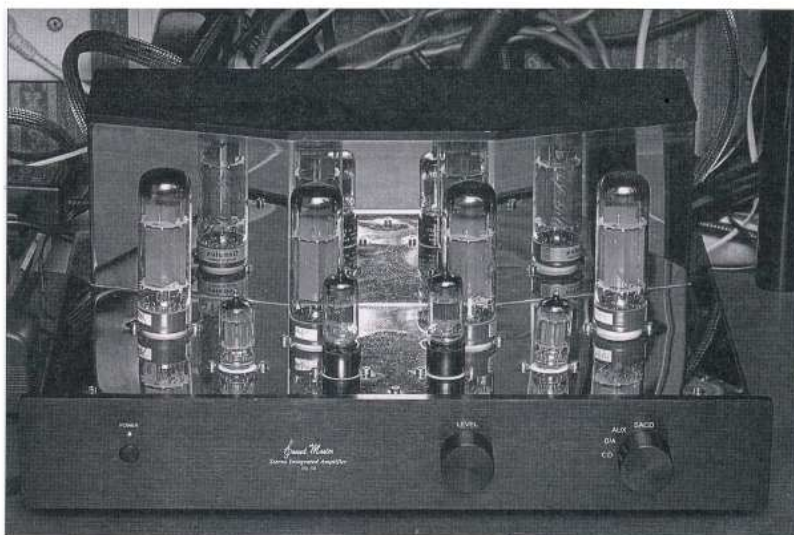
這就是呂先生第一部膽機—— SOUND MASTER No.34。

聽過一系列 SOUND MASTER 膽機的演繹，尤其是一曲《楊春白雪》，膽機所發揮出一份潤澤自然、活躍聲音，似乎是家中石機永世都無法營造出的，於是他們懶理懂不懂甚麼是膽機，一於「勇字當頭」，就此投入膽機世界，現在回想起來，這已是兩年前的的事了。最近筆者登門造訪，在百餘呎廳堂內我發現在一個自建的音響架上，竟然有兩套完全獨立的環繞聲與兩聲道體系，當中的兩聲道成員包括：