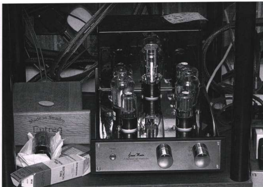
SOUND MASTER No.23 前級用了古董 45 膽，音效變得更加細緻。