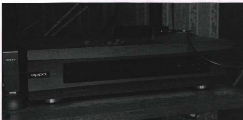
摩改版 OPPO BDP-95 看高清藍光碟固然悅目，重播 CD 的效果亦相當不俗。